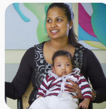
Ocean, 1145 gr