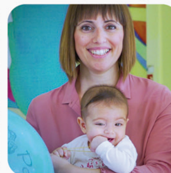
Virginia, 1456 gr